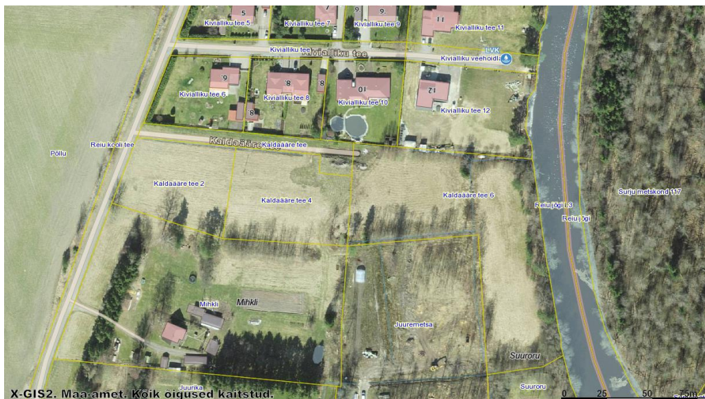
Joonis 3. Tuletõrje veevarustuse asukohaskeem. Veevõtukoht märgitud sinisega.

Lähim veevõtukoht LVK ID 4173 (kaugus ca 350 m, vt. Joonis 3). Tagatud on tuletõrjevee vajalik vooluhulk 10 l/sek 3 h jooksul, mis teeb arvutuslikuks koguseks 108 m 3 . Kinnitu suurus on piisav ka eraldi tuletõrjevee mahuti paigaldamiseks. Juurdepääsuteede kandevõime 20t, pöörderaadiused 12m ja laiuses 3,5m. Tuletõrje veevõtukohtadele on tagatud aastaringne juurdepääs ning kasutamise valmidus ja tulekahju kustutamiseks vajalik veekogus või vooluhulk ning tähistatus vastavalt tehnilisele normile või õigusaktile.